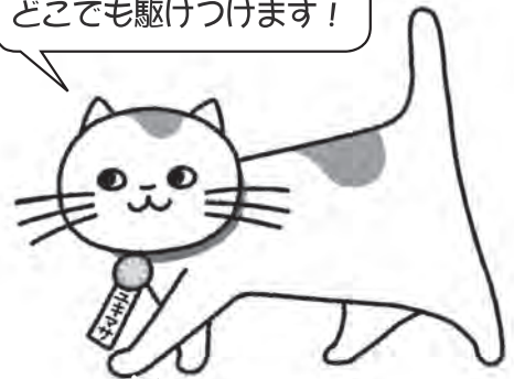
行政書士のマスコットキャラクター ユキマサくん