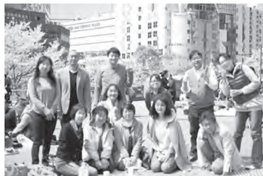
桜の下で 睦菜のは～な～ ン?

*ブロックメーリングリストに登録希望の方はMail: sunfish121@softbank.jpにご連絡を