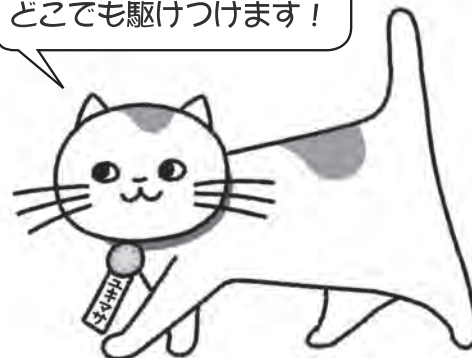
行政書士のマスコットキャラクター ユキマサくん