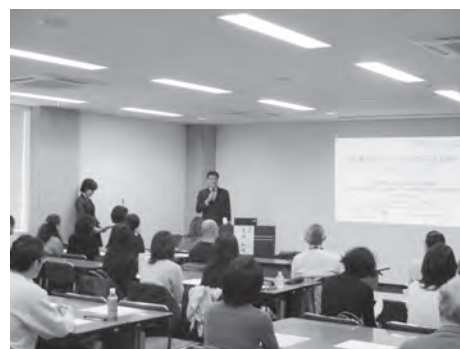
2017年度フォレンジック・ ソーシャルワーク研修写真

支援につなぐだけでなく、本人の思いを聞き出す力が必要であること、コミュニケーション力が必要だと感じました。