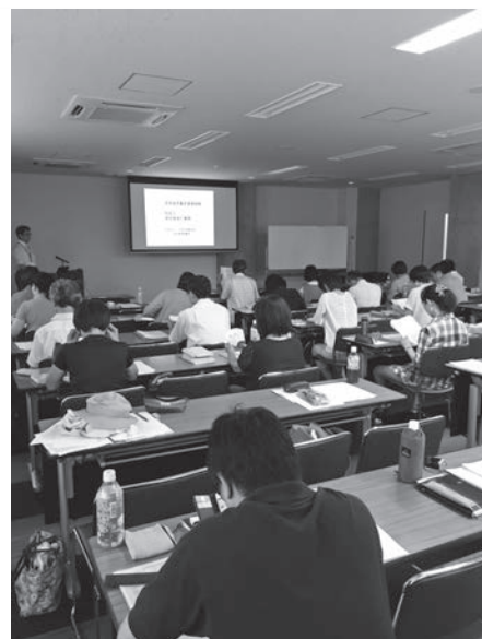
成年後見基本実務研修

参加者の約7割が未受任であった為、後見実務に関して学ぶ事が多く、受任した際に実践で役に立つと実感しました。また、改めて成年後見という専門性について深く考える機会となり、自分自身の振り返りに繋がりました。