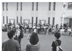
プラスポルテニョによるオープニングセレモニー