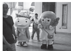
「かもめん」と「あかはねちゃん」