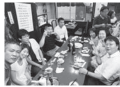
37人参加の打ち上げ