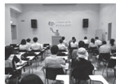
知って得する市民講座「成年後見制度について」