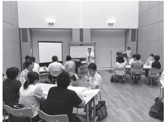
阪神ブロック初任者勉強会

し合うことが出来ました。グループの話し合いで上がった意見の中には、このように顔の見える関係が出来ることで、これからもお互いに助け合う繋がりが出来たことは、今回の勉強会の大きな収穫の一つとなったという話がありました。