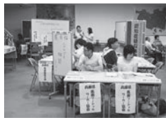
福祉なんでも相談