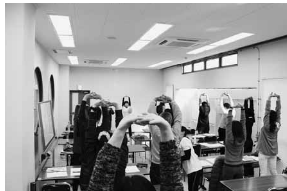
脳活性化ヨガ体験