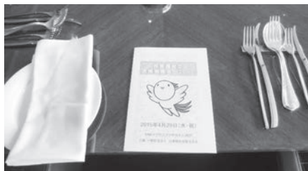
ANAクラウンプラザホテルのランチ

2015年4月29日、ANAクラウンプラザ神戸36階レストランにて、平成27年度社会福祉士国家試験合格祝賀会が開催されました。参加者の14名は昨年度、国家試験対策委員会が主催する「国家試験受験対策講座」を受講し、第26回社会福祉士国家試験に合格した方です。参加者は先輩社会福祉士と国家試験受験の苦労を話したり、これから社会福祉士としてどんな仕事をしていきたいか等の話をし、「社会福祉士会に入会します!」と笑顔で帰って行きました。