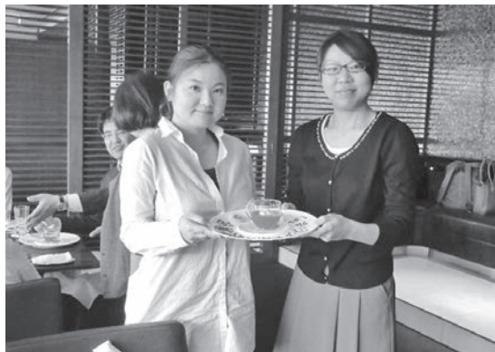
参加者のお二人☆社会福祉士会に入会します!