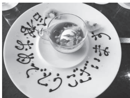
合格者にお祝いの言葉