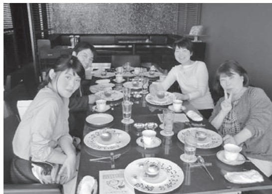
国家試験対策委員の先輩と歓談