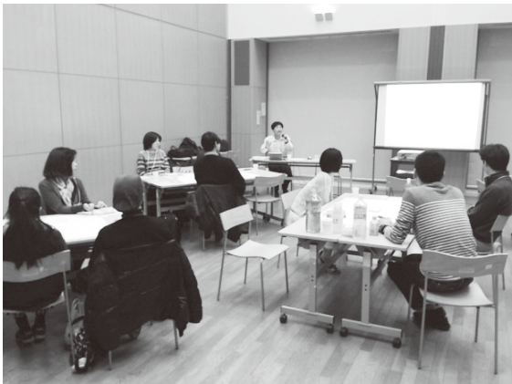
やってみよう!!ワールドカフェ

阪神ブロックでは、今後も初任者勉強会を開催する予定です。初任者の方々が仕事をする上での悩みを気軽に言える場、阪神ブロックの会員の顔が見える勉強会を目指して取り組んでいきたいと考えています。