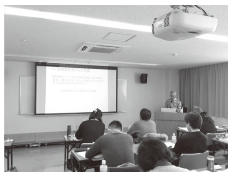
本会委員による講義