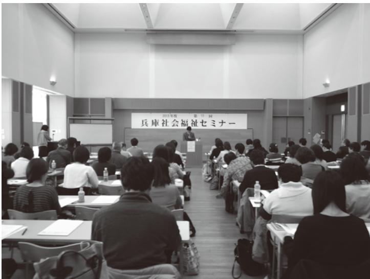
熱心に講義に聞き入る参加者