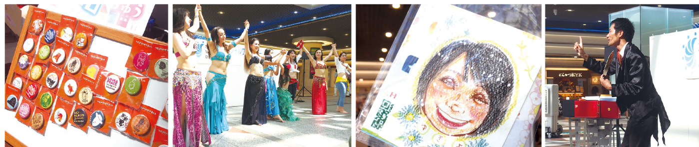
上段左:「ぐりいと」クラウンパフォーマンス/下段左より:東北物販・「Alwan」ベリーダンス・「お絵かきまを」似顔絵コーナー・「ハッピー」演田お笑いマジック