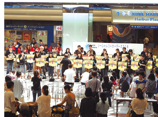
吹奏楽の音色が開催テーマ「ココロの開港」のファンファーレに。