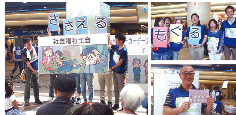
あなたの生活のどんな場面で社会福祉士が登場するでしょう!/?右下:スタンプラリーで会場をぐるり!