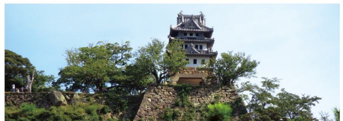
別名「三熊城」。国の史跡にも指定されています。